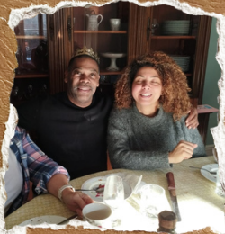
lors de la galette des rois