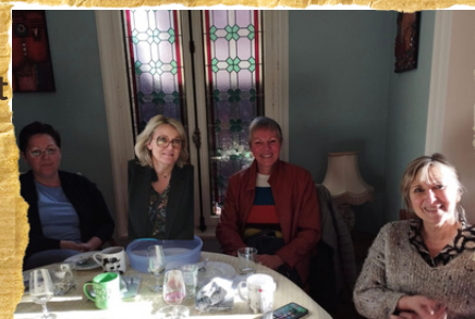
du prochain congrès.