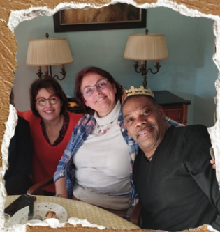
Le bureau presque au complet